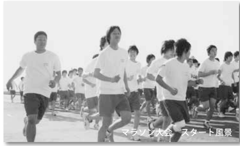
マラソン大会 スタート風景

私が見ても有機、無機分析化学など幅広い分野があります。また大学に上っても色々な特色があります。そんな中で一つだけ選ぶのは難しいことですが、早くに調べておくことで勉強に対する意識が変わってくるのではないかと思います。 私が受験をすることはもうないと思いますが、これから受験を経験する皆さんがこのことを受験に活かしてくれればと思います。