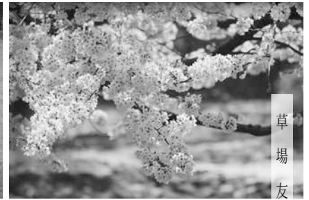
草 場 友 光 (平11曹)