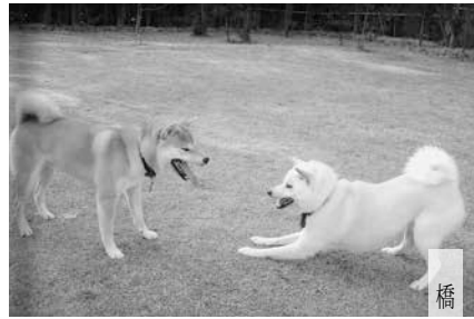
橋 本 慎 一 郎 (平4曹)