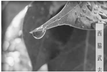
西脇 武志 (平15曹)